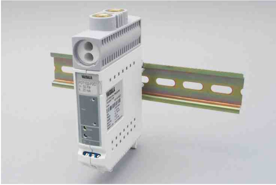
维萨拉微差压变送器PDT102配有过程阀门执行器和测试插座